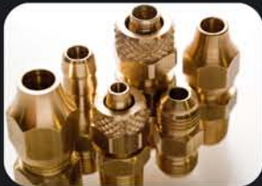
Conexiones de Bronce

Zonas Libres para Distribuidores y Viajantes