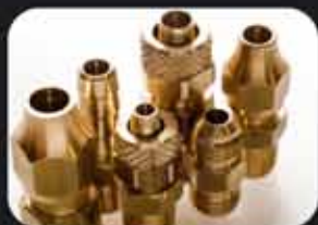
Conexiones de Bronce

Zonas Libres para Distribuidores y Viajantes