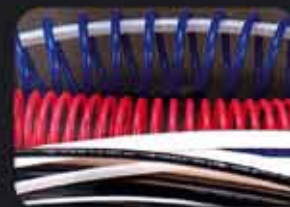
Tubos y mangueras

Saavedra 2965/69 . Rosario . Santa Fe . Argentina - 54 341 4317593 www.metalurgicasanzo.com.ar - info@metalurgicasanzo.com.ar